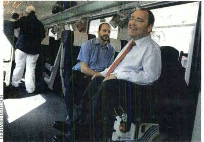
8.47 Uhr: Ankunft in der Felberstraße – 53 Minuten vor der Zug-Abfahrt